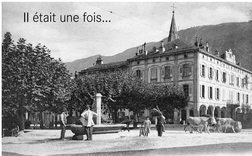
Hôtel de Ville, vers 1905

Après plusieurs projets avortés, la proposition de l'architecte Emile Vuilloud fut retenue pour la construction d'un Hôtel de Ville à Martigny (1866-1867). Le bâtiment connu quelques rénovations (1923, toit et façades) avant d'être équipé en 1926 d'un réseau d'eau chaude. Puis, entre 1947 et 1949, Marc Morand - président de la Ville de 1921 à 1960 - confia la responsabilité d'importants travaux à l'architecte Léon Mathey. Ceux-ci permirent notamment la construction de l'imposant vitrail historique d'Edmond Bille (55 m 2 ) dans la cage d'escalier. Aujourd'hui siège principal de l'administration communale, l'Hôtel de Ville accueille notamment les séances du Conseil municipal et du Conseil général.