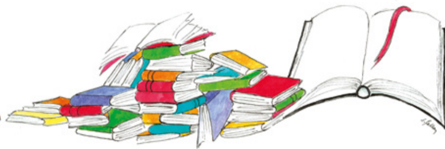
Illustration Dominique Feilley