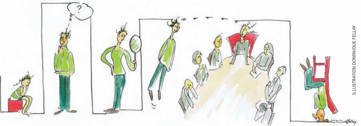
ILLUSTRATION DOMINIQUE FELLAY