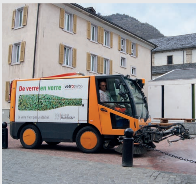
Bernard Mock, employé municipal, aux commandes de l'un des deux véhicules balisés pour susciter les bons comportements.