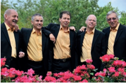
Les « 5 cops » quintet vocal made in Martigny région