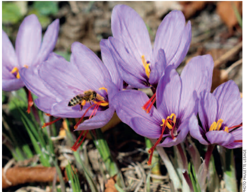
Même si elle n'est pas aussi connue que le village haut-valaisan de Mund, la région du coude du Rhône peut également se targuer de posséder quelques cultures de safran . Récolté à la fin octobre, cet « or rouge » est extrait du crocus sativus dont les stigmates sont séchés pour être utilisés comme épice dans de nombreuses spécialités culinaires.