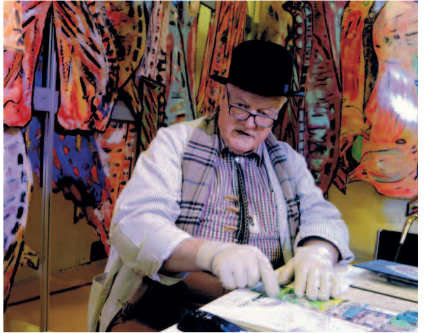
Peintre, sculpteur, dessinateur, maître boucher et cuisinier appelé aussi « le peintre de la viande », Le Boucher Corpaato a présenté des œuvres ayant pour sujet la cochonnaille. Un thème de circonstance puisque cette exposition a eu lieu en marge de la Foire au lard dans la « Grange à Emile » nouvellement réaménagée.