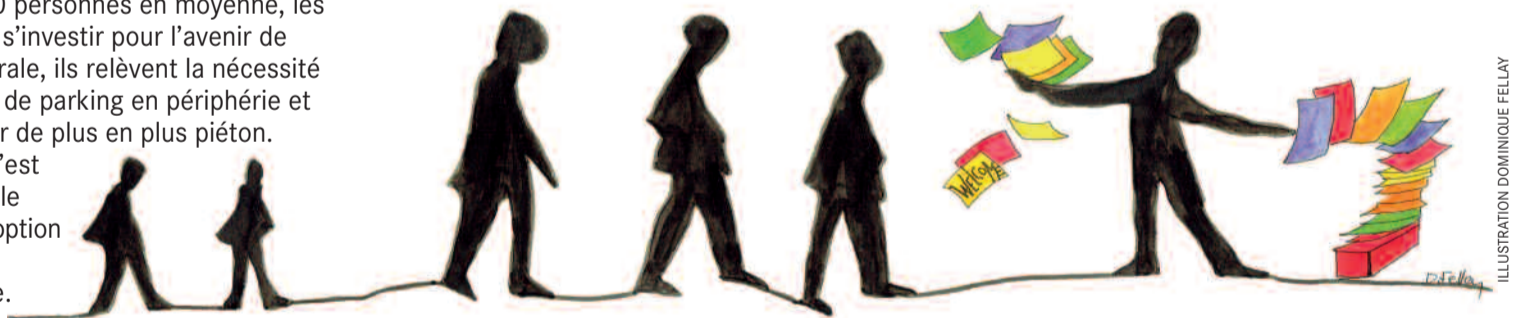
ILLUSTRATION DOMINIQUE FELLAY

D'ici fin 2016, le Conseil municipal recevra un rapport de la commission d'édilité du Conseil général basé sur les souhaits exprimés lors des trois soirées consultatives organisées par la Municipalité en mars, juin et septembre. Avec une participation de 80 personnes en moyenne, les Bordillons ont eu à cœur de s'investir pour l'avenir de leur quartier. De façon générale, ils relèvent la nécessité d'augmenter les possibilités de parking en périphérie et de voir ainsi le Bourg devenir de plus en plus piéton. Entre le pavé et le bitume, c'est une solution mixte qui semble l'emporter à condition que l'option retenue soit adaptée aux personnes à mobilité réduite.