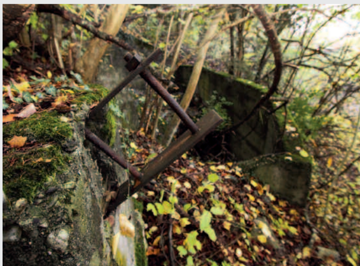
Le minerai arrivait au Guercet en téléphérique avant d'être emmené par camion à la Gare.