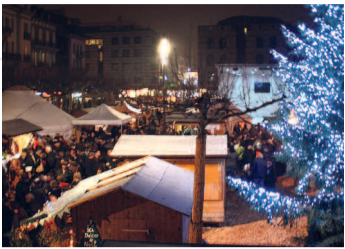
Le marché se tient cette année du 13 au 23 décembre.