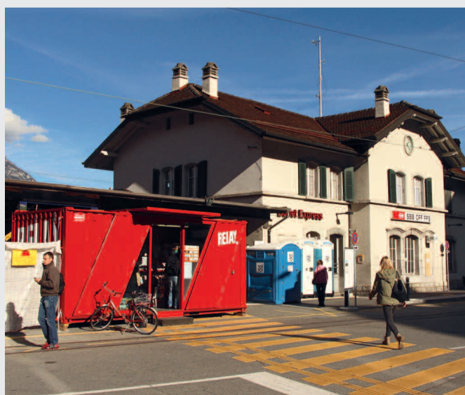
La gare de Martigny en novembre 2013.

Les CFF ont décidé de rénover complètement leurs anciens bâtiments (construits entre 1880 et 1950). En investissant plus de 2,7 millions de francs à Martigny, la régie fédérale a prévu un nouveau centre de vente CFF et de nouveaux commerces (Migrolino, Subway et Relay Naville) qui ouvriront leurs portes au printemps 2014. La fin des travaux est prévue pour juin 2014.