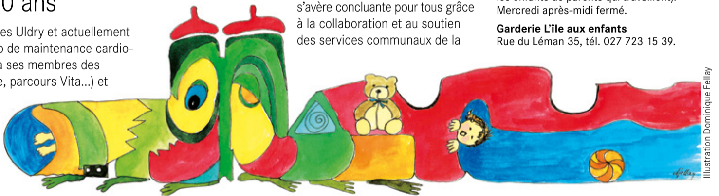
Illustration Dominique Fellay