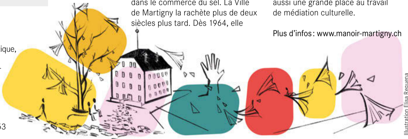
Illustration Elisa Requena

Prochain rendez-vous: samedi 9 novembre de 9h à 14h à la rue d'Oche (paroisse protestante). Rens.: 078 910 24 53