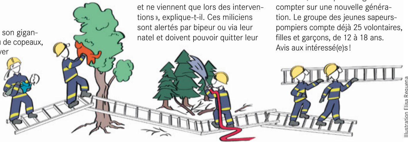
Illustration Elisa Requena