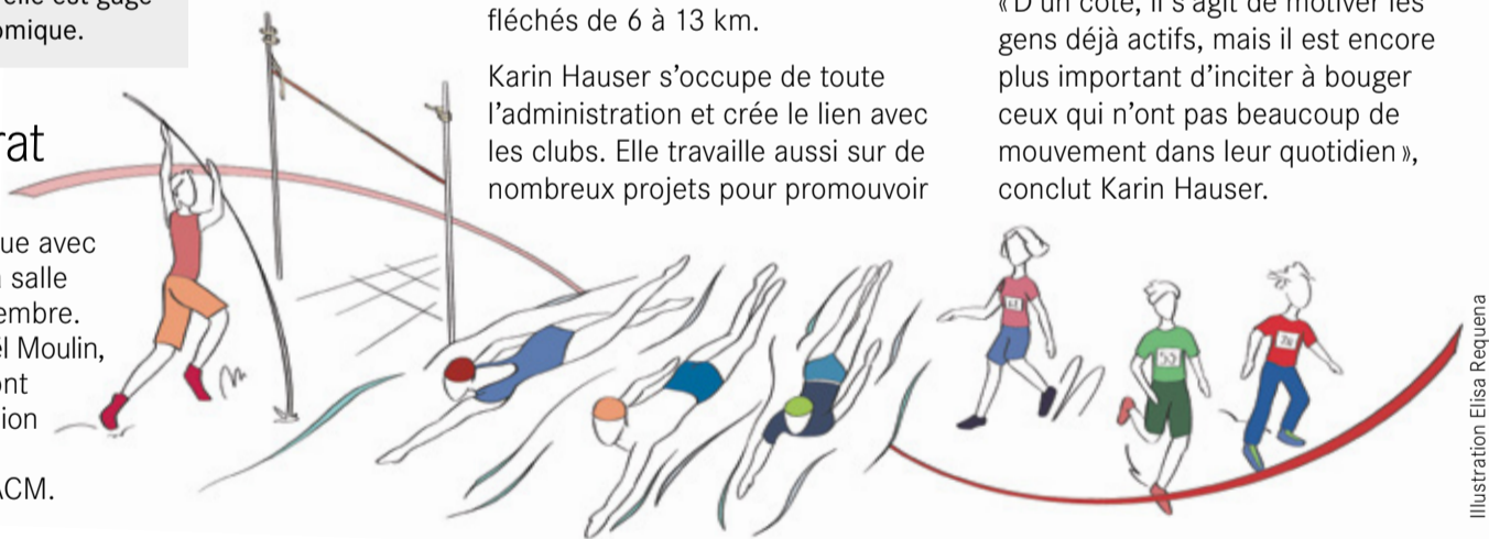
Illustration Elisa Requena

Après une interruption forcée en raison de la pandémie, l'Amicale de Charrat renoue avec l'organisation de son marché artisanal à la salle communale du village les 17, 18 et 19 novembre. Outre le sculpteur et hôte d'honneur Raphaël Moulin, de nombreux artisans et artistes exposeront leurs œuvres. Le marché sera aussi l'occasion pour les écoliers de Charrat de présenter ce qu'ils ont réalisé lors de leurs cours d'ACM.